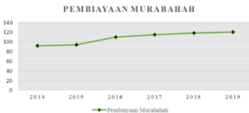
Gambar 1. Grafik Pembiayaan Murabahah

Salah satu produk utama yang disediakan oleh bank syariah adalah pembiayaan Murabahah. Murabahah adalah salah satu akad jual beli yang paling umum diterapkan dalam fiqih muamalah Islam di perbankan syariah. Secara prinsip, akad Murabahah adalah akad jual beli barang yang di dalamnya dinyatakan dengan jelas harga beli dan keuntungan (margin) yang telah disepakati antara penjual dan pembeli. Pembiayaan Murabahah sering dimanfaatkan untuk pembelian aset seperti rumah, kendaraan, atau peralatan usaha (Sudarsono A. , 2023).