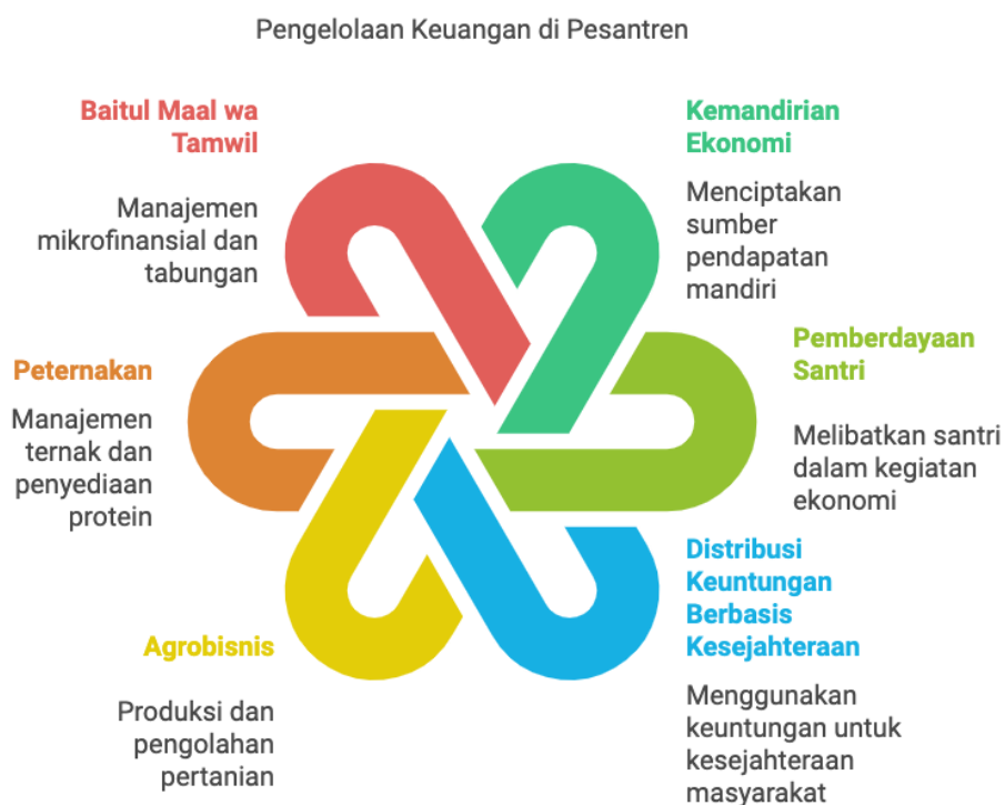
Gambar 2. Pengelolaan Keuangan Pesantren.

Sumber keuangan Pesantren An Nahdliyin Lerang dikelola secara terintegrasi melalui berbagai sektor, mencerminkan praktik terbaik yang ditemukan dalam manajemen keuangan pesantren berbasis asrama. Dalam sektor agribisnis, pesantren memanfaatkan lahan pertanian untuk menanam komoditas seperti cabai rawit, yang hasilnya diolah menjadi produk bernilai tambah seperti boncabe. Hal ini sejalan dengan temuan di Sekolah Asrama Bustanul Wildan, di mana pengelolaan agribisnis menjadi pilar utama keberlanjutan keuangan dengan mengembangkan produk turunan yang meningkatkan margin keuntungan (Aripin, 2024). Selain itu, sektor peternakan, khususnya pengelolaan sapi, tidak hanya memenuhi kebutuhan protein tetapi juga menjadi sumber pendapatan tambahan, sebagaimana ditunjukkan oleh pesantren lain yang mengadopsi pendekatan serupa untuk mendukung stabilitas ekonomi (Rahmawati et al., 2023). Pesantren An Nahdliyin Lerang juga mengoperasikan Baitul Maal wa Tamwil (BMT) sebagai lembaga keuangan mikro yang menghimpun dana dari santri dan masyarakat sekitar, menggemakan praktik umum di pesantren yang memanfaatkan BMT untuk pembiayaan usaha kecil dan pemberdayaan ekonomi (Chamidi, 2023). Di samping sumber pendapatan mandiri, pesantren ini menerima donasi dan wakaf yang diarahkan untuk pembangunan fasilitas, selaras dengan temuan bahwa sumbangan masyarakat dan wakaf sering menjadi tulang punggung pengembangan infrastruktur pendidikan (Minan, 2022).