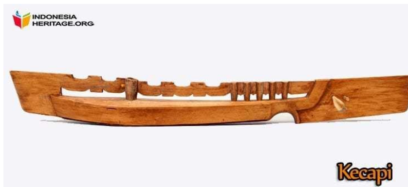
Gambar 4. Kecapi Bugis

Musik dapat menyeimbangkan fungsi otak kanan dan otak kiri sehingga menyeimbangkan aspek intelektual dan emosional. Musik juga dapat menyehatkan jiwa sebagai pendekatan belajar (terutama berhitung) dan mengajarkan sopan santun sehingga dapat menyalurkan emosinya secara positif untuk mencegah terjadinya tindak kekerasan. Dengan demikian, tidaklah berlebihan bila musik dikatakan sebagai pendidik humanis