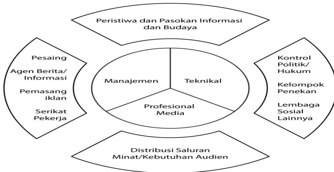
Skema 2.1 Organisasi media ditengah kekuatan berpengaruh

Kepungan kekuatan yang ada disekitar media tidak serta merta membuat media lemah atau berdifat negatif dan justru menjadi sumber pembebasan. Misalnya adalah regulasi pemerintah yang melindungi kebebasan media dari tekanan. Dengan kata lain, tekanan yang diterima media merupakan hal yang wajar, bahkan dinilai perlu. McQuail mengemukakan, lack of external pressure would probably indicate social marginality or insignificance . Maksudnya ialah organisasi media yang tidak menerima tekanan justru menunjukkan bahwa media tersebut dianggap tidak penting oleh masyarakat.