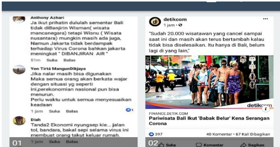
Gambar 2.1 potret opini publik terhadap kasus virus corona terkait wisatawan.

corona , dan lain-lain. Pusaran perhatian publik tidak hanya itu, tapi juga terjadi pada kolom komentar di media-media online. Satu yang menjadi perhatian penulis ialah detik.com, secara aktif para pembaca menyuarakan opininya. Beberapa menyuarakan keraguan maupun optimisme terhadap virus corona terhadap ekeftiitas dampaknya.