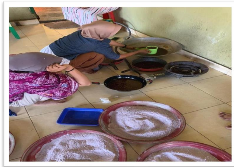
Pengolahan dan Tahap Pemasakan